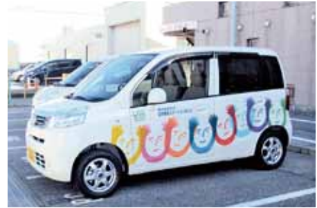
日本財団の助成を受けて整備した車両