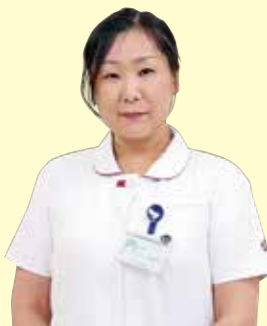
認知症看護認定看護師

A. 認知症看護は認知機能の障害の程度、症状の進行具合に加え、個人の思いや生活習慣、性格や素質などが大きく関わるため、マニュアルにすることが難しいと言われています。認知症看護認定看護師として習得した知識や技術を活かし、病棟のスタッフと協力し合いながら一緒に認知症看護について考え、実践していきたいと思っています。病院は治療の場です。自宅に戻られてからの生活を入院中からご家族と話し合い、退院調整をしていく必要があります。ご家族の不安を少しでも軽減できるようお手伝いをしたいと思っていますので気軽にお声をかけください。