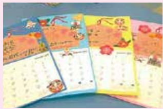
患者さまが作ったカレンダー

加された患者さまも、病棟に戻った後は穏やかに過ごされたり、夜間ぐっすり眠れたと笑顔で言っていたり、出来上がった作品を通して会話が増えたりと様々な効果が見られています。こうした様々な活動は、患者さまが入院中安全に治療を受け、安心して療養生活を送ることのできる環境の提供につながり、元の生活に戻れるようお手伝いすることができ、チーム医療であると思っています。