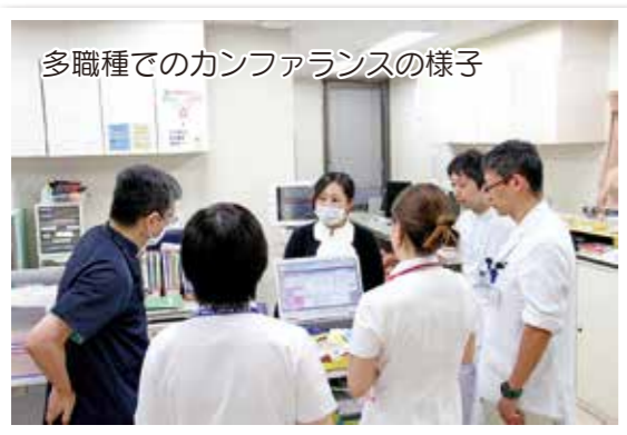
多職種でのカンファランスの様子

※スクリーニングとは、自覚症状のない病気が異常を識別する検査をし、一定の条件でふるい分けすること。