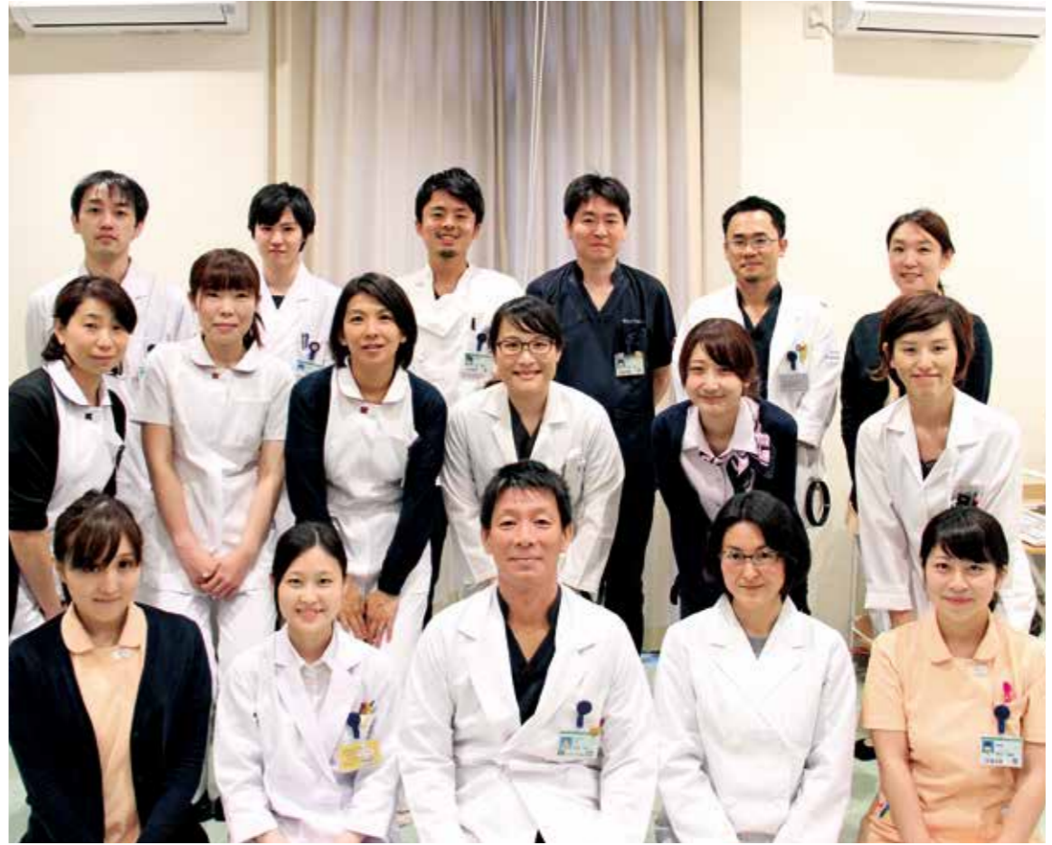
聴覚センターのスタッフ