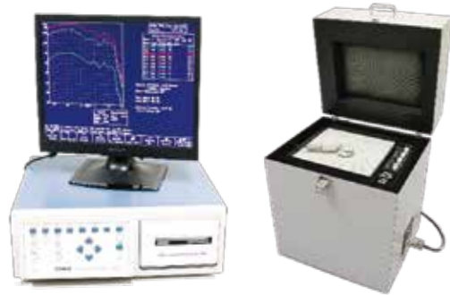
●補聴器周波数特性装置