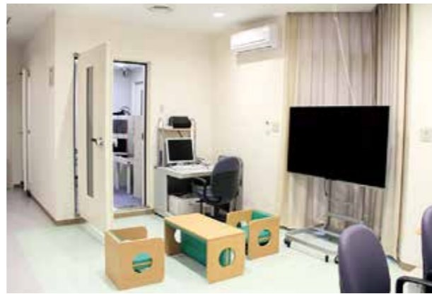
●遊びを通して行うハビリテーション専用のプレイルーム