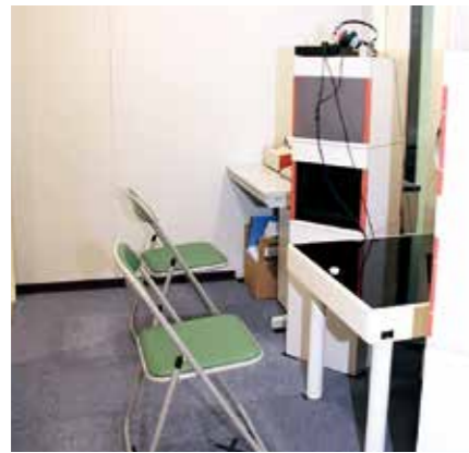
●プレイルーム内検査室