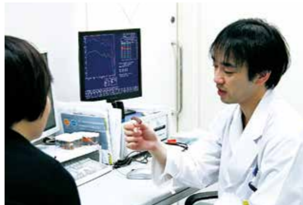
●補聴器の調整機器を使用して調整を行っている様子