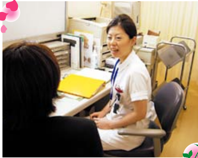
↑ストーマケア外来診察室のようす

平成21年4月より、ストーマケア外来を開設いたしました。「ストーマケア」に関するご相談をお受けしている外来です。当院でストーマを造設されたストーマ保有者（オストメイト）である患者様が、受診されています。