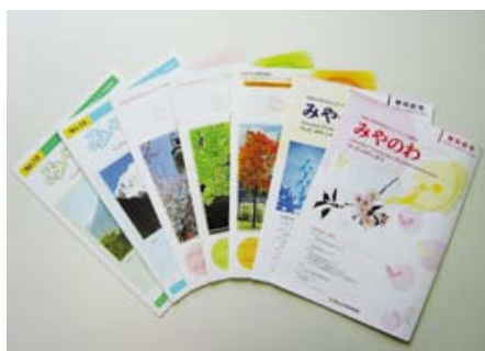
↑みやのわバックナンバー (デザインが変わっても、より良い広報誌を届けたいという思いは変わりません。)

この度、当委員会のメンバーが4月より一新することとなりました。これを機に更なる有意義な情報提供ができるよう頑張っていくたいと考えております。皆様の手に取って頂ける「みやのわ」を発行していきたく思いますのでこれからもよろしくお願い致します。