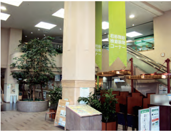
↑エントランスホールに新しく初診問診・検査説明コーナーができました。

また、初診の患者さまの問診を電子ペンで取り込んだり、検査の説明を行う「初診問診・検査説明コーナー」や「車いすコーナー」が新たに設置されました。