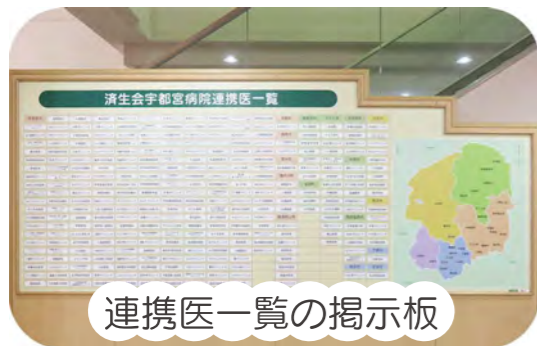
連携医一覧の掲示板

ご不明な点などがあれば1階「医療相談室」にお声かけください。お住まいの地域の連携医施設をご案内することができますので、お気軽にお立ち寄りください。