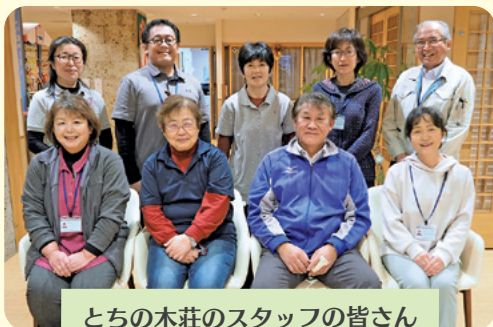
とちの木荘のスタッフの皆さん