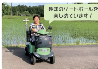
電動車いすレンタル