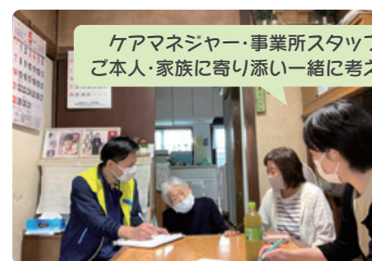
サービス担当者会議の様子