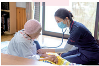
お身体の状態の観察