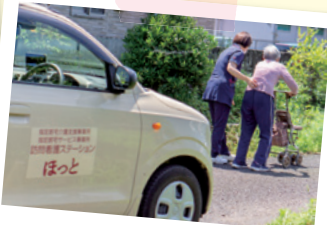
お散歩・歩行練習

その他、病状をチェックしながら、医療機器の管理、食事・排泄・清潔のサポート、心のサポート、ターミナル(終末期)ケアなどを行っています。