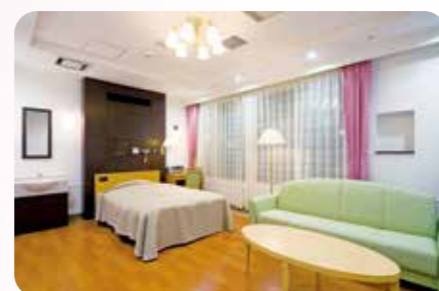
バースセンター LDR室(9階)

従来の分娩施設とは別に、助産師のみの運営による自然分娩施設として2008年にバースセンターを開設しました。当院最上階の静かなフロアに助産師外来機能とLDR室（陣痛から分娩、回復まで対応する特別個室）を4室設け、年間約120例の正常分娩を行っています。分娩台を使用せず、自由な場所で自由な体位で産むことができます。ご家族の立ち会い出産や、配偶者の方の宿泊も可能です。