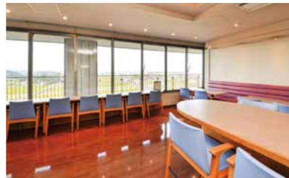
カフェクレール(本館9階)