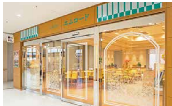
エムロード(南館1階)