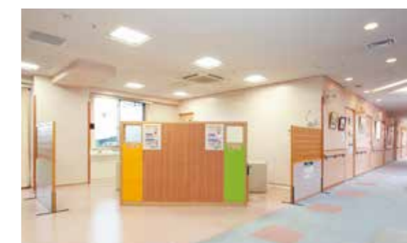
採血・計測コーナー（3階） 採血や血圧など身体の基本情報を計測いたします。