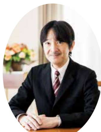
総裁 秋篠宮皇嗣殿下