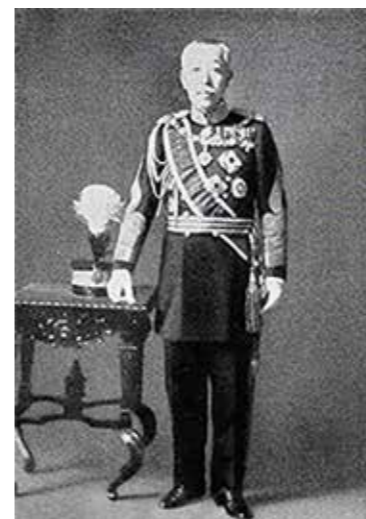
初代総裁・伏見宮貞愛親王殿下