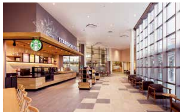
スターバックス(南館1階)