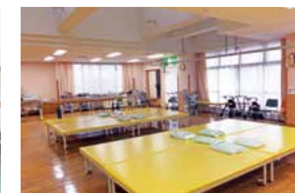
リハビリテーションセンター