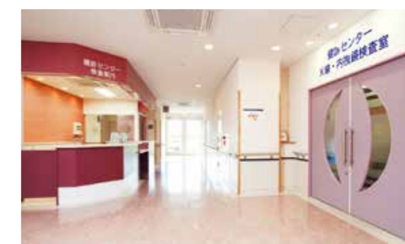
受付（1階） 人間ドック専用放射線検査・内視鏡検査の受付です。