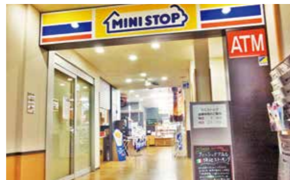
ミニストップ(本館1階)