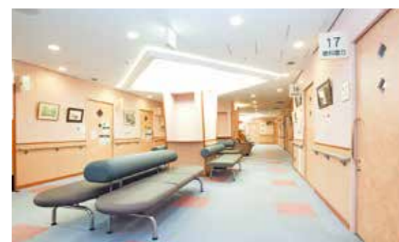
待合（3階） 検査の合間に広々としたスペースでおくつろぎいただけます。

認定を取得した技師が提供した正確なデータを、病院の専門医が診断してレポートします。看護師や管理栄養士による、生活習慣改善に向けた面談などにも力を入れています。