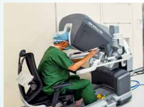
手術支援ロボット「da Vinci Xi」

地域におけるがん診療の中核病院として、専門的で質の高いがん診療の提供と情報発信に努めています。