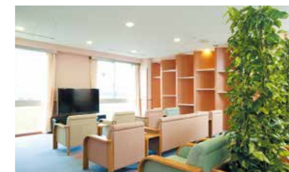
待合ホール（3階） 大画面テレビを設置し、ゆったりお待ちいただけます。