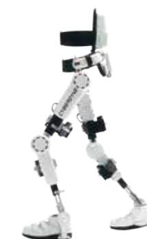
医療用リハビリロボット「HAL®」

高い天井にフロアリング、清潔で快適な空間で、安心したリハビリテーションが行われています。医療用リハビリロボット「HAL®」も活用しています。