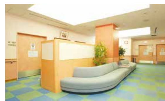
待合（1階） 人間ドック専用の放射線検査・内視鏡検査スペースです。

各種の高性能検査機器を備えており、一連の検査を内部で完了できます。また、電子カルテなどの充実したネットワークシステムにより、院内の専門診療科への診察や検査の予約を行うことができます。