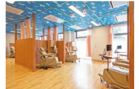
リクライニングチェア(10床)