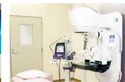
マンモトーム生検システム