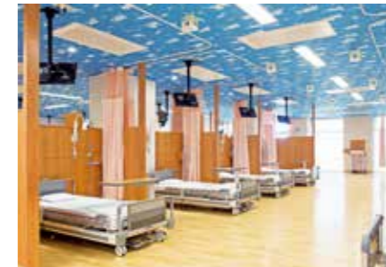
化学療法センター ベッド(20床)