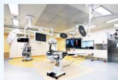
ハイブリッド手術室

手術台と血管撮影装置を組み合わせたハイブリッド手術室を整備。手術室とカテーテル室、それぞれ別の場所にあった機器が同室に設置されています。ハイブリッドな手術によって、患者さんにより低侵襲かつ効果的な治療が提供できます。