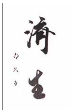
第4代総裁 高松宮宣仁親王妃喜久子殿下による御書