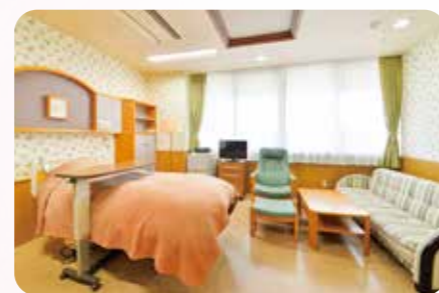
母子医療センター LDR室(4階)

母子医療センターとして周産期不妊部門32床、NICU小児循環器部門18床、婦人科病棟25床を有し、不妊症から周産期、婦人科悪性腫瘍に至るまで、産婦人科領域のあらゆる疾患に対応し得る診療体制を整えています。また、病院自体が栃木県救命救急センターを併設し、地域の第3次救急の役割を担っているため緊急搬送が多く、産婦人科も常時救急に備えています。