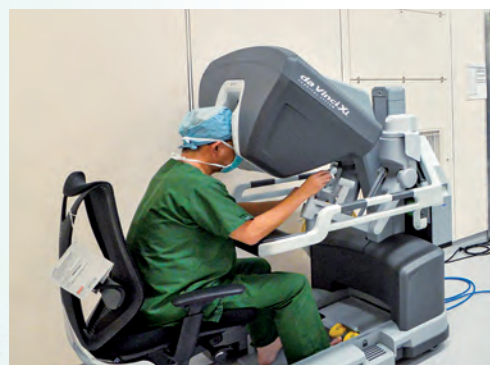
手術支援ロボット [da Vinci Xi]

地域におけるがん診療の中核病院として、専門的で質の高いがん診療の提供と情報発信に努めています。