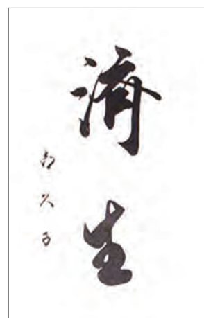
第4代総裁 高松宮宣仁親王妃喜久子殿下による御書

朕惟フニ世局ノ大勢ニ隨ヒ 國運ノ伸張ヲ要スルコト 方ニ急ニシテ經濟ノ狀況 漸ニ革マリ人心動モスレハ 其ノ歸向ヲ認ラムトス政ヲ 爲ス者宜ク深ク此ニ鑑ミ 倍々憂勤シテ業ヲ勸メ 教ヲ敦クシ以テ健全ノ發 達ヲ遂ケシムヘシ若夫レ 無告ノ小窮民ニシテ醫藥 給セス天壽ヲ終フルコト 能ハサルハ朕ク最軫念シテ 措カサル所ナリ乃チ施薬 救療以テ濟生ノ道ヲ弘ム トス茲ニ内帑ノ金ヲ出クシ 其ノ資ニ充テシム御克ク朕ク 意ヲ體シ宜キニ隨ヒ之ヲ 措置シ永ク敷庶ラシテ 頼ル所アラシムコトヲ期セヨ