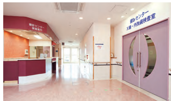
受付（1階） 人間ドック専用放射線検査・内視鏡検査の受付です。