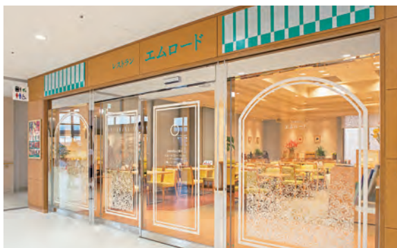
エムロード(南館1階)