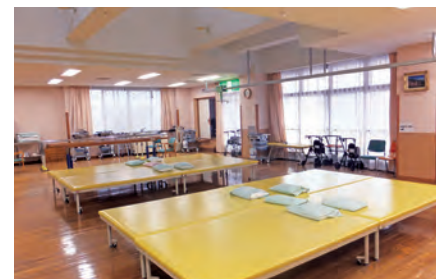
リハビリテーションセンター