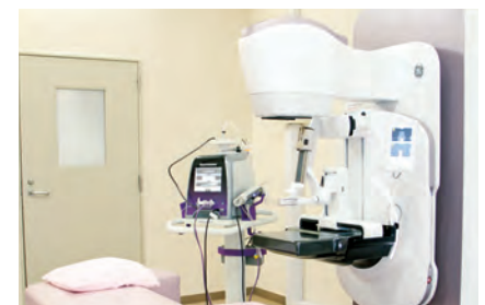
マンモトーム生検システム