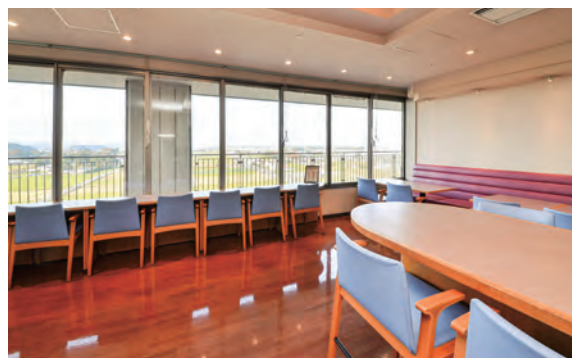
カフェレール(本館9階)