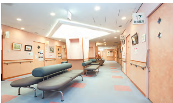
検査待合（3階） 検査の合間に広々としたスペースでおくつろぎいただけます。

認定を取得した技師が提供した正確なデータを、病院の専門医が診断してレポートします。看護師や管理栄養士による、生活習慣改善に向けた面談などにも力を入れています。