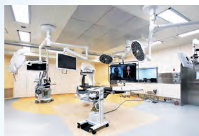
ハイブリッド手術室

手術台と血管撮影装置を組み合わせたハイブリッド手術室を整備。手術室とカテーテル室、それぞれ別の場所にあった機器が同室に設置されています。経カテーテル的大動脈弁置換術 (TAVI) の治療にも対応しています。