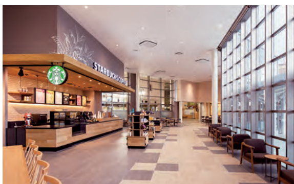
スターバックス(南館1階)