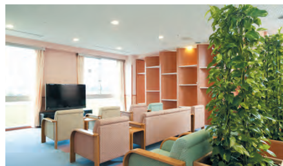
待合ホール（3階） 大画面テレビを設置し、ゆったりお待ちいただけます。