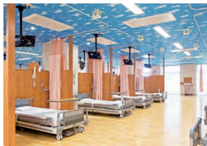
化学療法センター ベッド(20床)