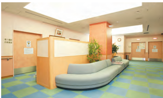
検査待合（1階） 人間ドック専用の放射線検査・内視鏡検査スペースです。

各種の高性能検査機器を備えており、一連の検査を内部で完了できます。また、電子カルテなどの充実したネットワークシステムにより、院内の専門診療科への診察や検査の予約を行うことができます。