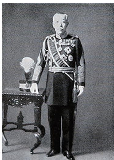
初代総裁・伏見宮貞愛親王殿下