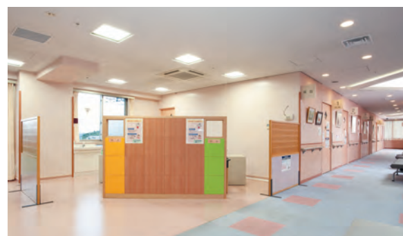
採血・計測コーナー（3階） 採血や血圧など身体の基本情報を計測いたします。