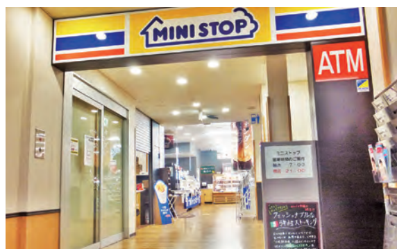
ミニストップ(本館1階)