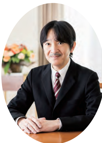
総裁 秋篠宮皇嗣殿下