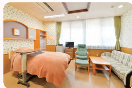
母子医療センター LDR室(4階)

母子医療センターとして周産期不妊部門32床、NICU小児循環器部門18床を有し、不妊症から周産期に関し広く対応できる診療体制を整えています。また、病院自体が栃木県救命救急センターを併設し、地域の第3次救急の役割を担っているため緊急搬送が多く、産婦人科も常時救急に備えています。