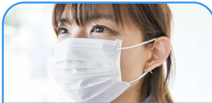
受診者の方へマスクの着用をお願いしています