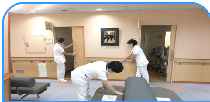
検査機器、ベッド、ロッカー、ドアノブなど施設内の消毒を強化しています