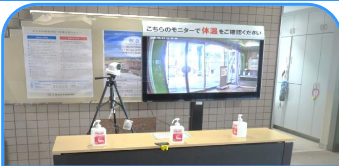
ご来院時、入口で検温・手指消毒を行っています

当健診センターでは平素より感染予防に努めておりますが、受診者の方が安心して健診を受診いただけるよう以下の感染予防対策を講じております。