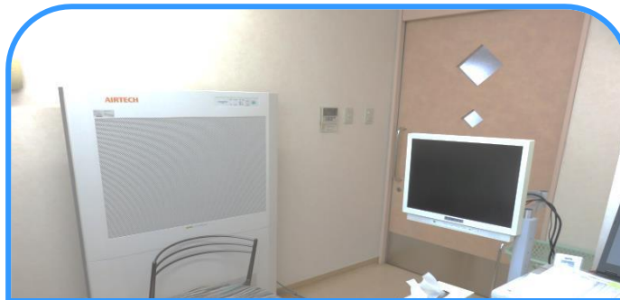
窓の開放、クリーンパーティション※の設置など施設内の換気を随時実施しています