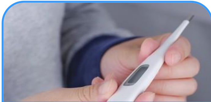
職員は1日2回検温を行い、異常を認めた場合は出勤停止としています

※ 空気中の含まれる細菌・ウイルスを清浄化することができるパーティションで、空気感染のリスクを軽減します。