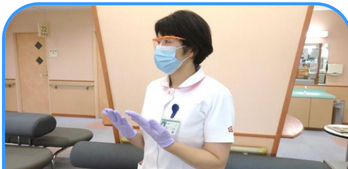
職員はマスク・アイシールド等を着用し手洗い・手指消毒を徹底しています